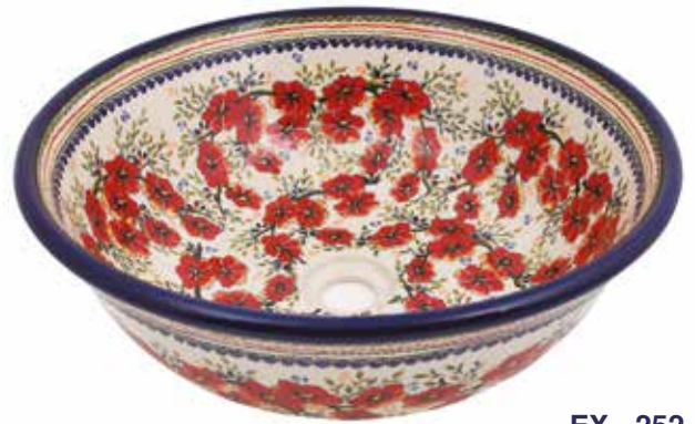
EX - 252