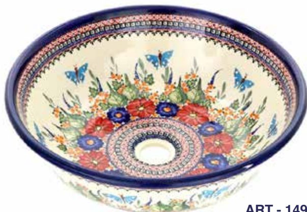
ART - 149