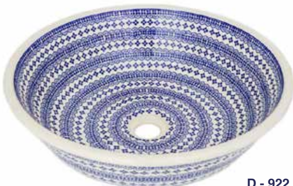
D - 922