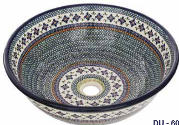
DU - 60