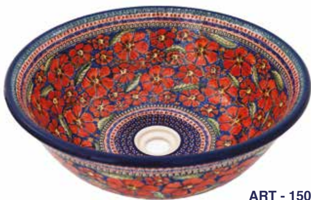
ART - 150