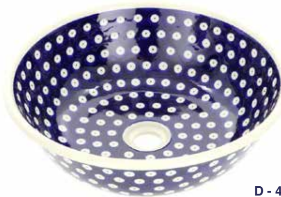
D - 42