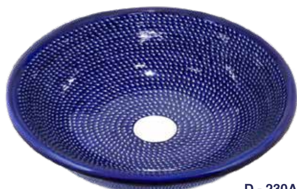
D - 230A