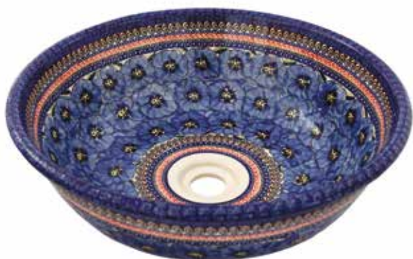
ART - 148