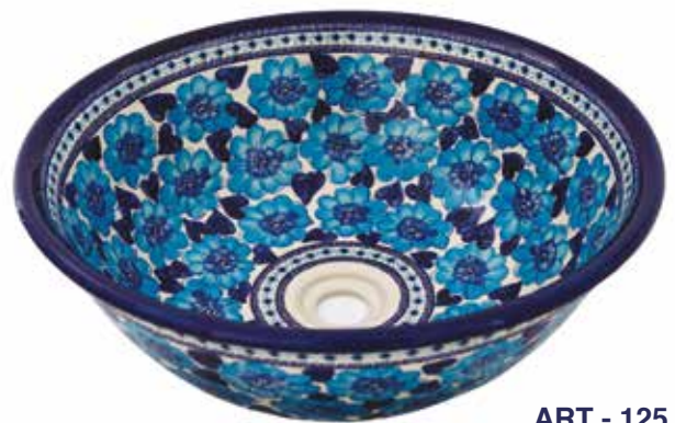
ART - 125