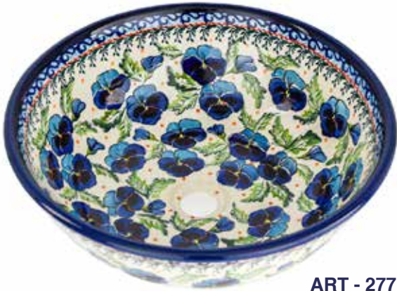
ART - 277