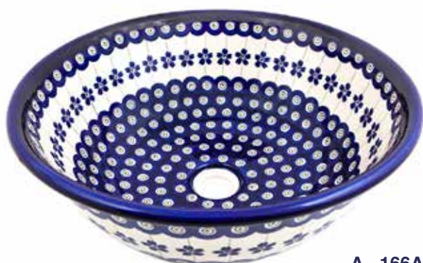
A - 166A