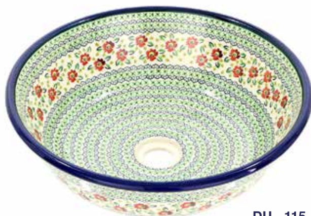
DU - 115