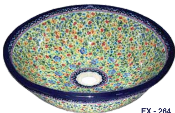
EX - 264