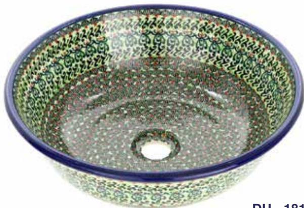
DU - 181