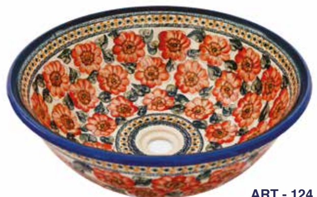
ART - 124