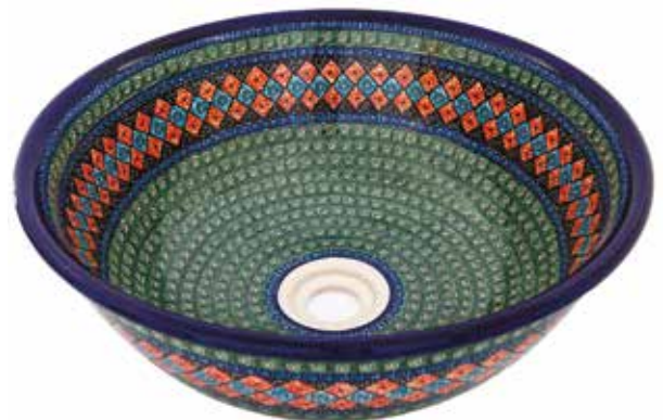
ART - 105